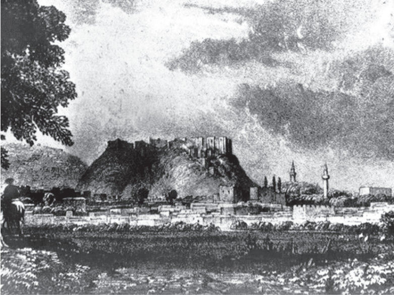
Resim 2: XVIII. Yüzyılın Başlarında Ayntab Şehri 39

Ayntab'taki Ermeniler, devletin koruyuculuğu altında huzur içerisinde yaşamışlardı 36 . Can, mal, ırz, namus ve din güvenceleri sağlanmıştı 37 . Diğer Osmanlı vatandaşları gibi Ermeniler de devlete ödemekle mükellef sair vergileri ekonomik güçleriyle bağlantılı olarak vermişlerdi. Ekonomik durumu yetersiz ya da düşük olanlar, iş göremeyenler, çalışmaya kudreti olmayanlar, kimsesizler, dul kadınlar, yetimler, öksüzler, yaşlılar, körler, kâr ve kisbe kadir olmayanlar ve vakıf meskenlerinde ikamet edenlere vergi muafiyeti tanınmıştı. Kamusal alanda hizmet gören Ermeniler, birtakım mükellefiyetlerden muaf tutulmuşlardı 38 .